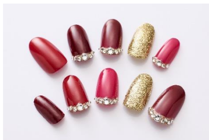
凰稀かなめさんデザイン 金子実由喜さん制作 (キャリアールネイルカレッジ)