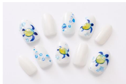
柏木由紀子さんデザイン 小田千裕さん制作 (ラ・クローヌ)