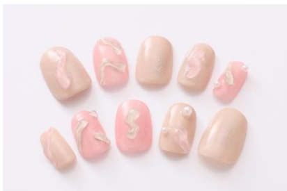
村上佳菜子さんデザイン なかやまちえこさん制作