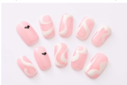
SAKURA さんデザイン 羽田由紀さん制作 (ネイルスタジオラッシュ)