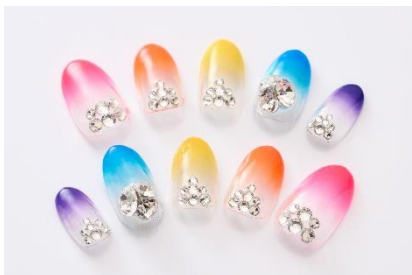
LiLiCo さんデザイン 森実まりさん制作 (プレスネイル)