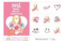
ピンクリボン ネイルアートシール