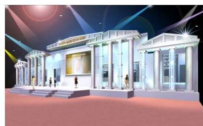
ネイルパントン(イメージ)