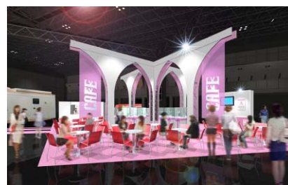
Pink Ribbon Café(イメージ)