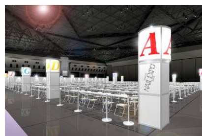
ネイルスタジアム(イメージ)