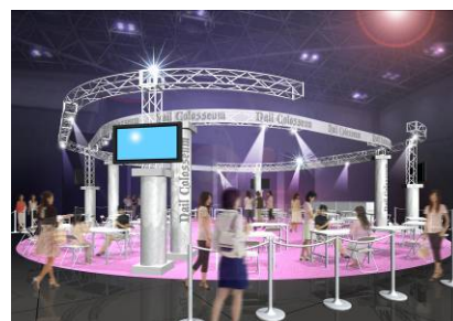
ネイルコロシウム(イメージ)